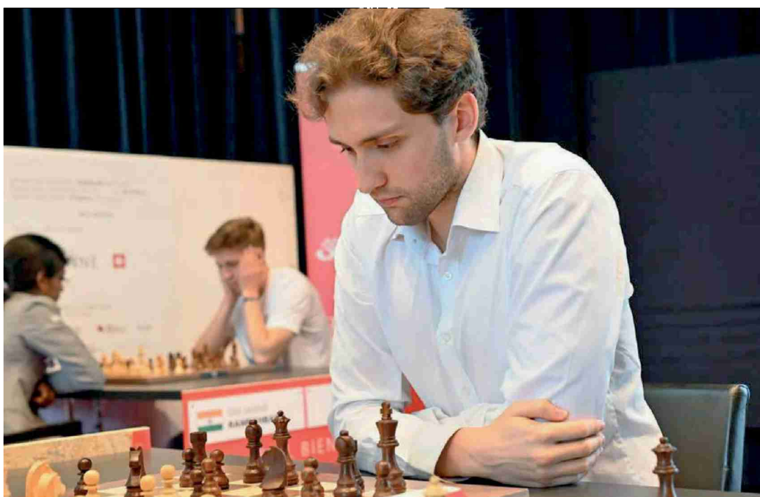
Alexander Donchenko est en tête du tournoi à égalité pour l'instant.

Festival international d'échecs Alexander Donchenko brille avec d'excellents résultats lors des premières parties du tournoi des Grands maîtres. L'Allemand raconte ses débuts, son évolution et ses nombreux trophées.