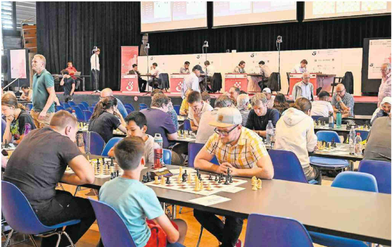
Das Schachfestival in Biel startet diesen Samstag.

Am Samstag beginnt das Bieler Schachfestival und holt Schachbegeisterte aus aller Welt in die Uhrenmetropole.